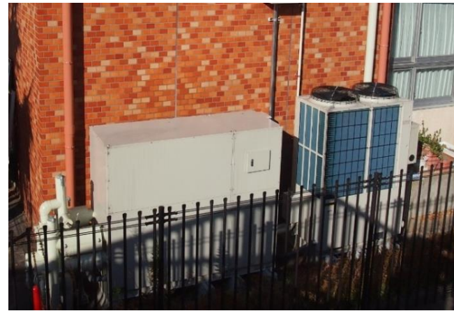
[熱源機器] 左) 地下水熱交換ユニット。井水-不凍液間の熱交換器や各種制御装置が収納されている。右) 空水冷ビル用マルチエアコン