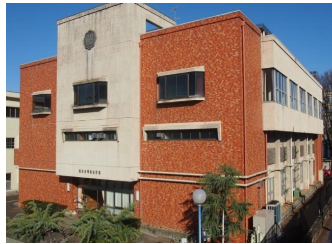
[施設外観] 建物1階が空調対象の公民館、2・3階は体育館。長良川扇状地に位置し、地下水温は夏季に低下、冬季に上昇する。