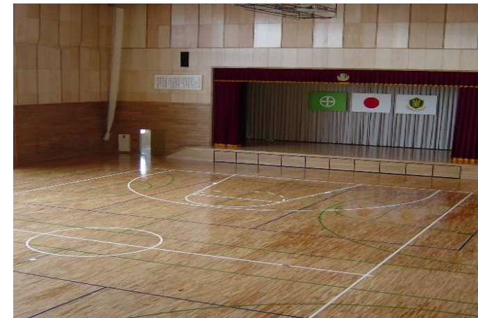
体育館全床面積1,036㎡のうち970㎡の床暖房を担う。