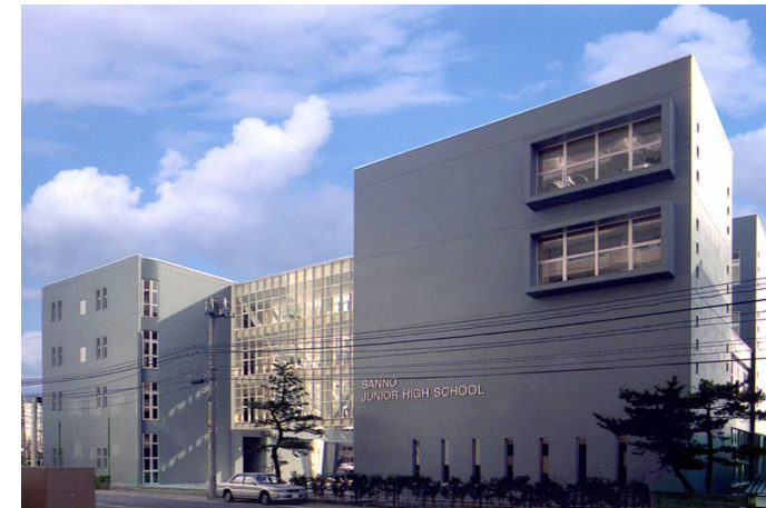
山王中学校正面風景。基礎杭方式による地中熱利用システムを採用。