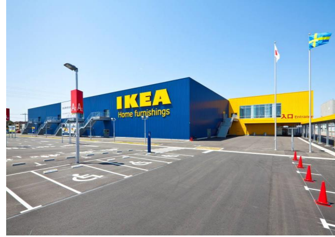
IKEAでは国内6店舗目の出店となったIKEA福岡新宮。 [施設外観]