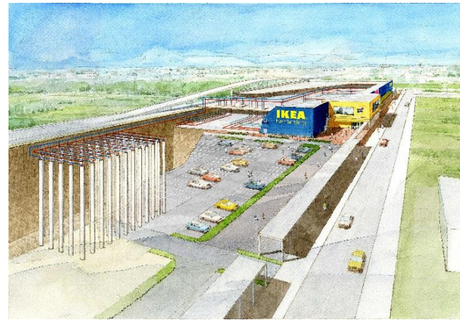
駐車場に深さ100mの地中熱交換器を70本掘削した。 [イメージ図]