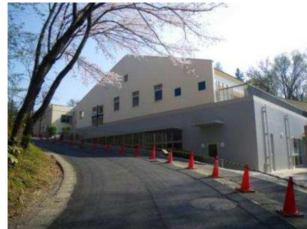
幼稚園の温水プールと遊戯室に地中熱システムを導入。 [施設外観]