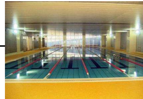
25m×6コース(水量337.5m³)の加温と室内の暖房を行う。 [施設内観]